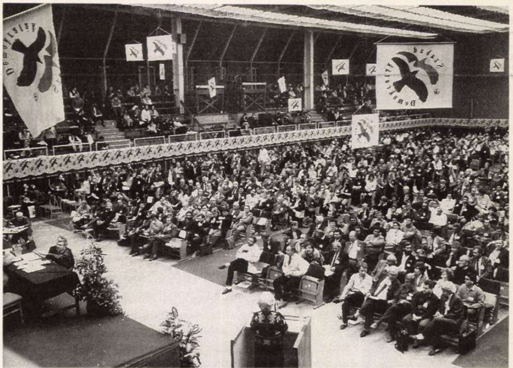
„Először jelent meg az SZDSZ közgyűlésén a fradista B-közép, füttyörészve, üvöltözve”

■ – Érezhetően ingerült. Azt írja magáról, úgyszólván végigfüttyörészte, végigmosolyogta, sőt végigvigyorogta a Kádár-korszakot. Most viszont ugyancsak komor.